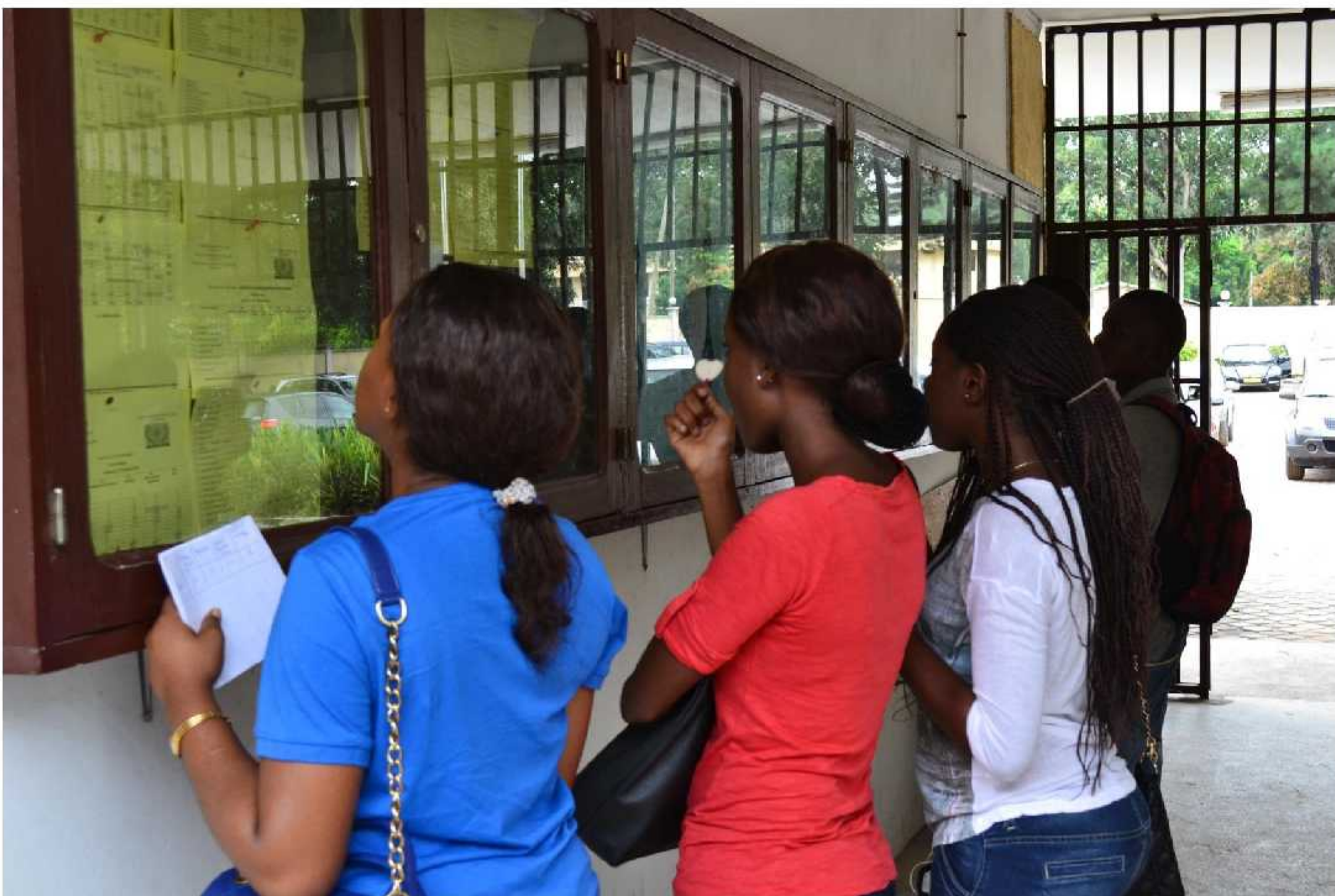
Etudiantes de la Faculté des Sciences de la Santé de l'Université Marien Nguoubi

Mathématiques ; Physique – Chimie ; Histoire – Géographie ; Philosophie et Education Civique ; Anglais ; Français ; Sciences de la Vie et de la Terre ; Sciences de l'Education ; Inspectorat des CEG (par Discipline).