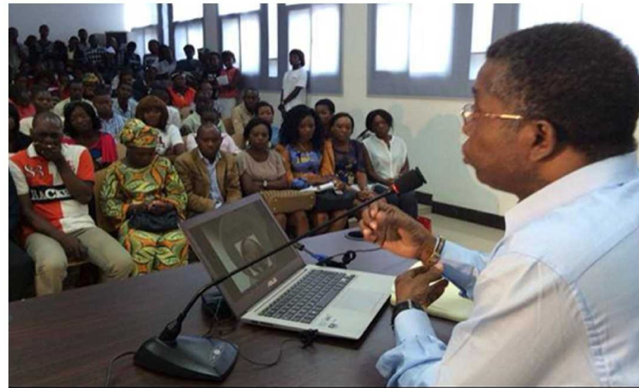
Conférence sur l'orientation professionnelle des étudiants de l'Université Marien Nguoubi

Espace Littéraire, Linguistique et Civilisations (ELLIC) ; Histoire ; Géographie ; Philosophie, Arts du spectacle et arts plastiques ; Anthropologie.